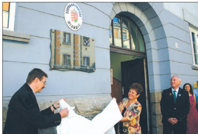
A bányakapitányság falára került az új emléktábla.

Mucsony), Edelényben és Párasznyán szeptember 4-én –, a megyénk 14 bányájában egykor dol-