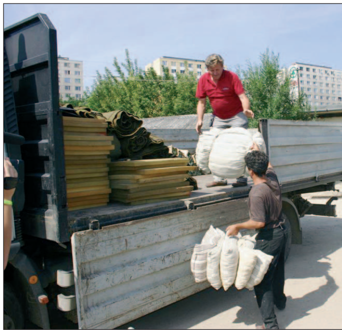
Alsóvadász, Szikszó, Mád, Tályá – képviselői teherautókkal el is szállították.

A Honvédelmi Minisztérium intézkedése nyomán tíz megye legérzékenyebb települései részesülnek árvízvédelmi eszközökben. Megyénkben tizenhat, leginkább rászoruló település kapott a szállítmányból, amely ásókból, lapátokból, csákányokból, ágybetétekből, fejpárnákból, takarókból, lepedőkből áll. A Budapestről érkező szállítmányt szerdán Gyárfás Ildikó, a Megyei Védelmi Bizottság elnöke fogadta. Az árvízvédelmi eszközöket a helyszínen kiosztották, és az érintett települések – többek között Encs, Szerencs, Sárospatak, Boldva,