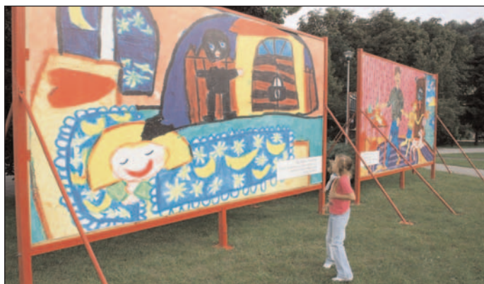
„Közös ügyünk a biztonság” címmel óriásplakát-kiállítás nyílt.

A felcímiben szereplő idézet Cesare Beccaria (1735-1794) olasz büntetőjogi bírójának napjainkban is érvényes tétele. A róla elnevezett Beccaria-program – melynek tanácskozással egybekötött záró rendezvényét a héten tartották meg a Miskolci Akadémiai Bizottság székházában – komplex, általános és középiskolai nevelési-oktatási modell-projekt.