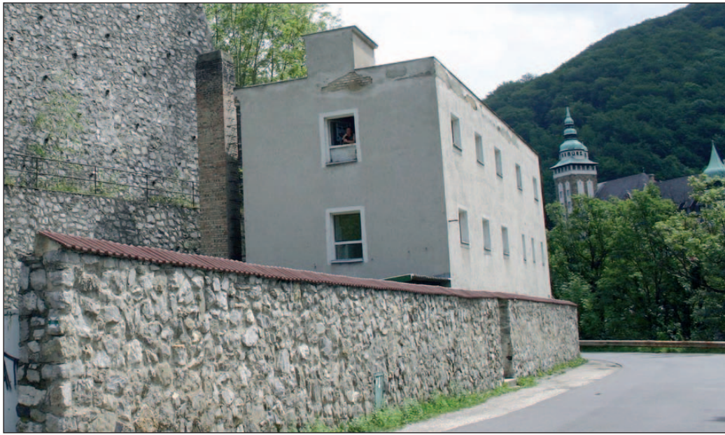
A lillafüredi Szikla, a leendő múzeum épülete.

1970-től minden év augusztusában ezek zárandokolnak az