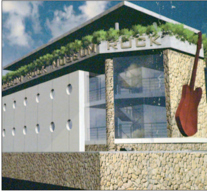
A miskolci Rockmúzeum látványterve.

És el, a szemközti megállóhoz. Onnan hallik: – Fiatalember!