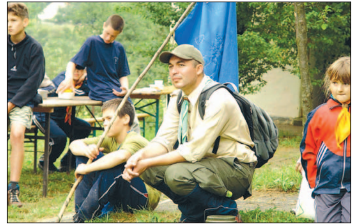
A gyerekeknek tetszett a tábort élet.

– A cserkészet közösség, ahol mindig számíthat az társadra, ahol testvéri szeretetben, egymást és másokat is segítve találsz igaz barátokra. A cserkészet szolgál, amelyre mindig készen állunk, ha szólít a kötelesség. Kaland, amikor a természetben túrázunk hegyeken, völgyeken át. Hazaszeretete, amely észrevétlenül állandó társaddá válik. A természet szeretete, amikor a szabadtéri, nomád élet elsajátítása közben megismerik, megszeretik és megtanulják tisztelni az állat- és növényvilágot – foglalta össze a