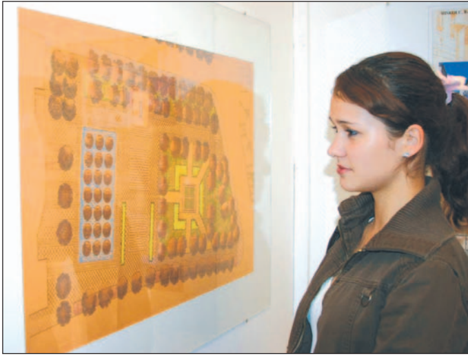
A galéria folyamatosan várja az érdeklődőket tárlataira.

Szeptember 15-étől egy hónapon át kanadai magyar képzőművészek munkái láthatók a Miskolci Galériában. A Kanadai