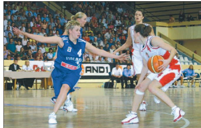
Miskolcon kitűnő játékkal magabiztos győzelmet aratott a magyar női kosárlabda-válogatott, amely száz százalékos mérleggel várhatja a folytatást.

A sorozatot a mieink Lengyelországban kezdték, ahol 61-58 arányban sikerült nyerni. Ez bravúr a javából, ugyanis a két évvel ezelőtti Európa-bajnokság negyedik helyezettjéről, a négy évvel ezelőtti Eb aranyérmeséről volt szó! A féldíj úgy tűnt, hogy a lengyelek érvényesítik a papírformát, hétpontos vezetésre tettek szert. A huszonnegyedik percen pedig tizenkét pontosra híztott a különbség a csapatok között! A magyarok nem adták fel, következett a fordulat. A palánk alatt fölénybe kerültek, fegyelmezetten védekeztek, és jól bírták a befejező tíz perc lélektani terhet is. Még az is belefért, hogy négy büntetőt kihasználatlanul hagytak.