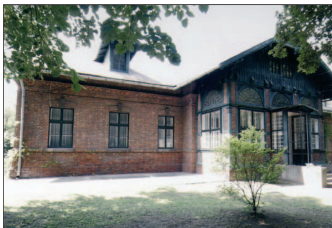
Az egykori igazgatói lakás ma közösségi ház.

A kolónia lakóházai közül különleges védettséget kell hogy élvezzen az egykori igazgatói lakás (Vasgyári u. 24. sz.). A földszintjén 7 szobás, bejárati folyosós, kétverandás, 6 más helyiséges, tetőtérbeépítéses lakóegyüttes 1889–1895 között készült el, ekkor kapott használatbavételi engedélyt. Később óvoda, majd bölcsőde működött benne, jelenleg pedig olyan közösségi ház, amelyben képzőművészeti, felső tereiben