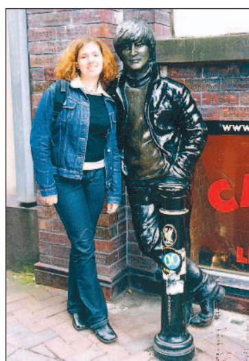
Liverpool-i utcakép John Lennon szobrával.

– Gazdasági szakértők szerint a 2008-as Európa fővárosa cím