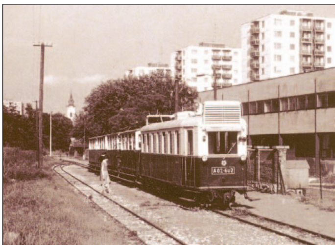
A zajos bérházak közül a nyugalmas Bükkbe vezető kisvasút. (Csoba Károly, 1980.)