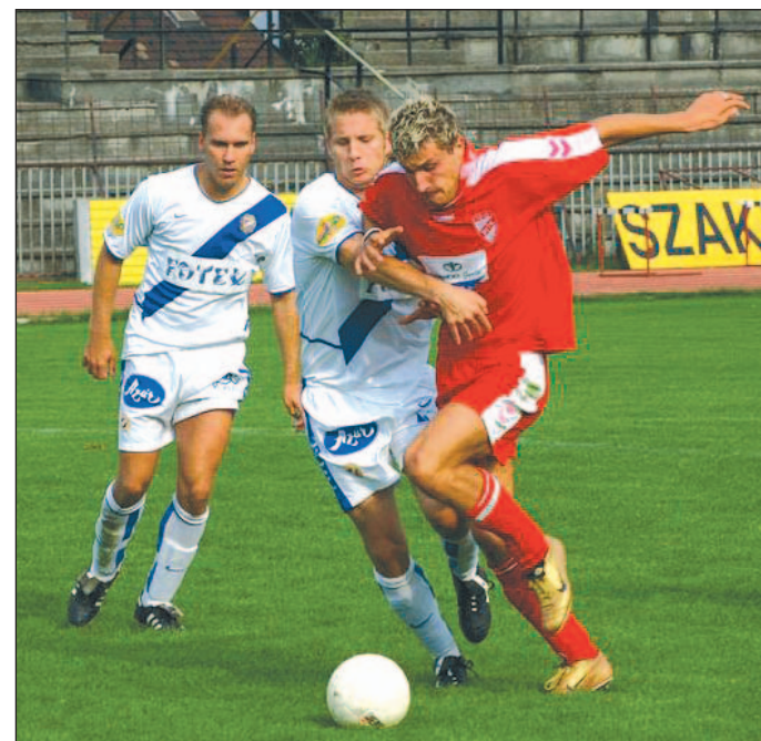
Diósgyőri vasárnap délután 17 órától az angol Ipswich Town ellen lép pályára a bajnoki főpróbát tartó DVTK.