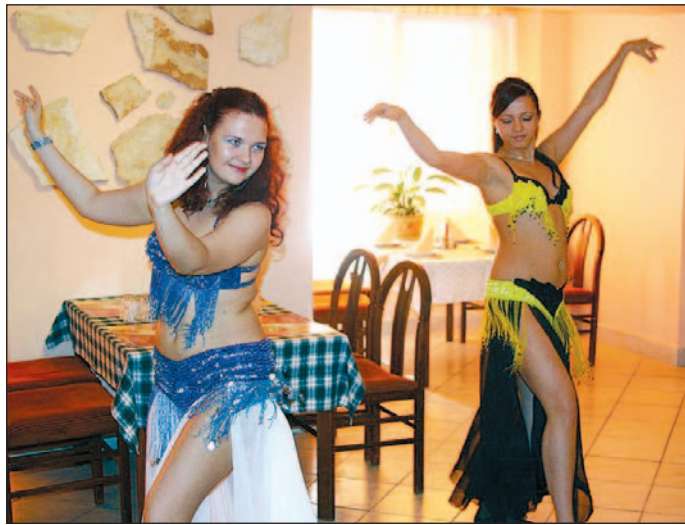
Has táncverseny és gála