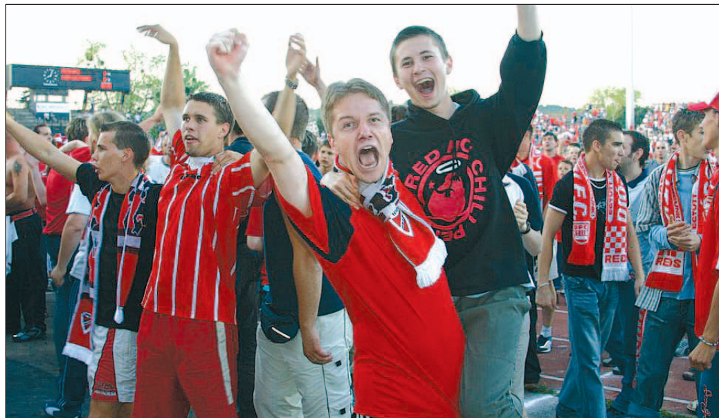
Miskolcon már biztosan nem szurkolnak EB mérkőzésen.