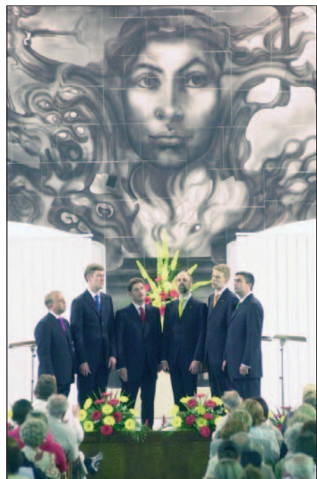
A Kings Singers az egyetemen adott nagy sikerű koncertet.

Sikerük volt azoknak a fiataloknak, akik hétfő este Rossini A seviliai borbély című operáját mutatták be a Nyári Színházban. A produkció a lipcsei Mendelssohn