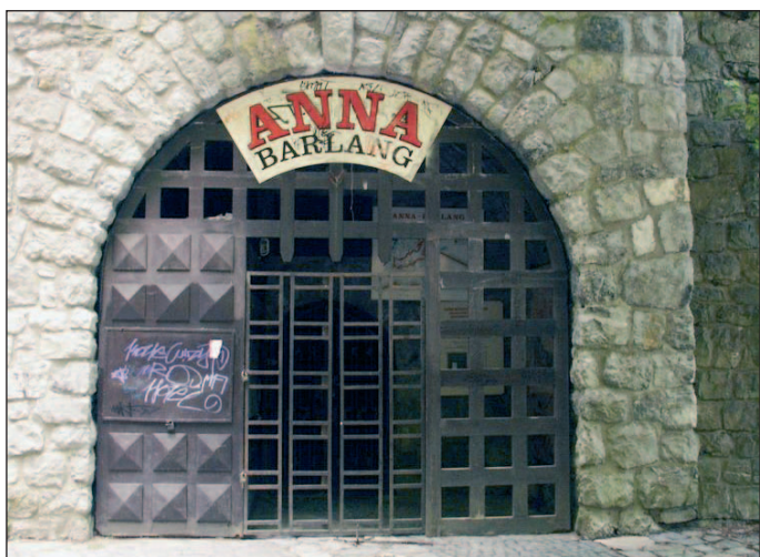
Európa ritka természeti képződménye a lillafüredi mésztufabarlang.