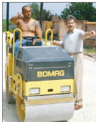
Elkezdődött az utca felújítása.

A 117 millió forintos beruházás keretében új, az eddiginél teherbíróbb burkolatot alakítanak ki, valamint korszerű csapadékvíz-elvezető rendszert azokon a szakaszokon, amelyeken eddig nem volt. Az út két oldalán megszüntetik az árkokat, ezáltal azok szélesebbé válnak, és lehetőség lesz két közlekedési nyomsáv, valamint buszváró-öblök kialakítására.