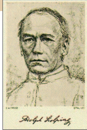
Kolping Adolf, a munkásból lett kölni pap.

E mozgalom lényegéről és a miskolci Szent Anna Kolping Család életéről beszélgettünk az itteni egyesület alapító (világi) el-