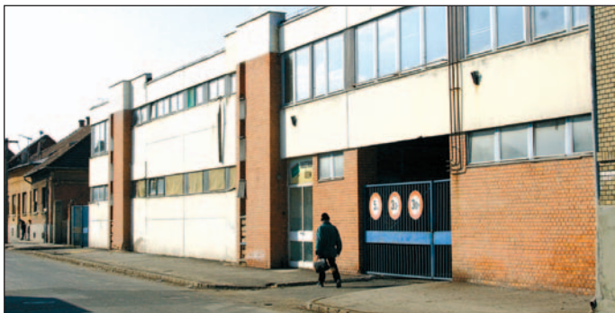
A Miskolci Vendéglátóipari Vállalat egykori épülete.

Meglehetősen nagy vihart kavart annak idején a Miskolci Vendéglátóipari Vállalat privatizációja.