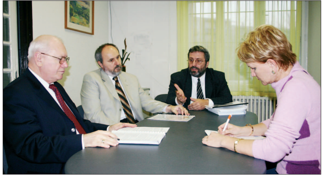
Elkészült Miskolc 2007–2013 közötti időszakra vonatkozó fejlesztési stratégiája