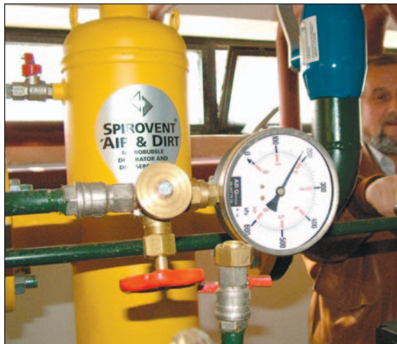
A Mihó egyik korszerű hőközpontja.

saját hőerőmű építésével kapcsolatban a Mihó Kft. és a Magyar Villamos Művek Rt. 2002 márciusában a megál-