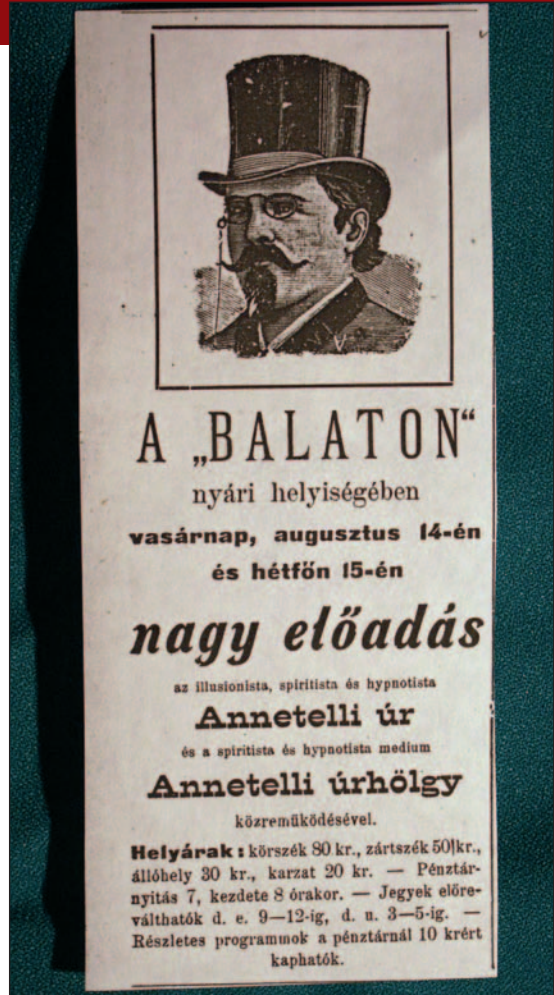
A Balaton kávéház nyári programja, 1898.

A háború után a kávéház nevet változtatott, időközben a színház is városi tulajdonba került, s ahogy a városra nehezedett a trianoni határon túlról menekülő sokasága, annak valamennyi tehertételével, úgy szűnt meg a „boldog békeévek” világa, annak számos éltetőjével, így a kávéházak egykori va-