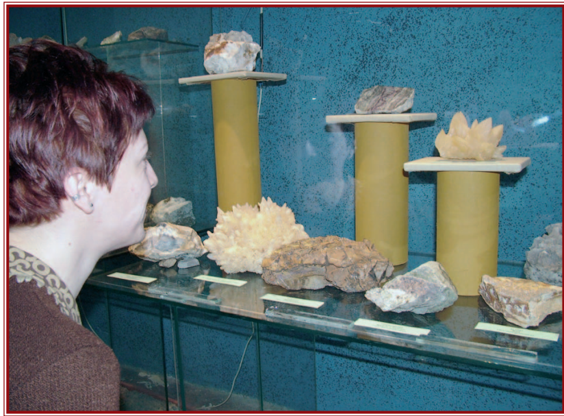
Az ásványfesztivál kuriózumokkal is várja a természet iránt érdeklődőket.