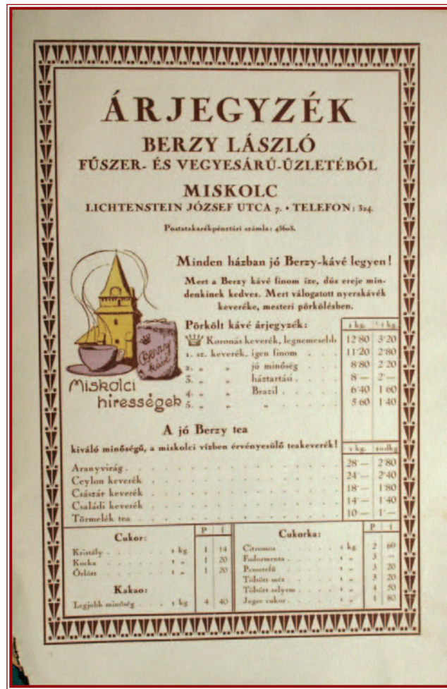
A török-görög kávé a miskolci „hirességek” között, 1931.