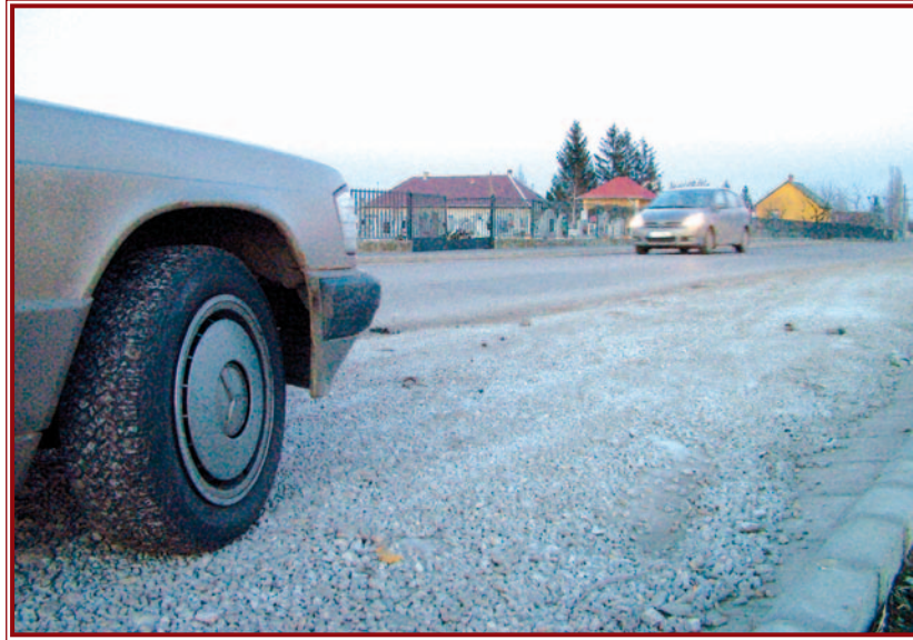
A temető melletti parkoló idén aszfaltszönyeget kap.

„A Bem József Általános Iskola gyermeklétszámának növekedése miatt régóta esedékes már az épület bővítése, aulára és új tornateremre feltételül szüksége lenne az iskolának. Az új épületszárny tervezése az elmúlt évben megtörtént, a kivitelezés folyamatban van. A Radnóti Miklós Községi Ház – amely a közművelődési megállapodás megkötése után a Szirmai Baráti Egyesület kezelésébe