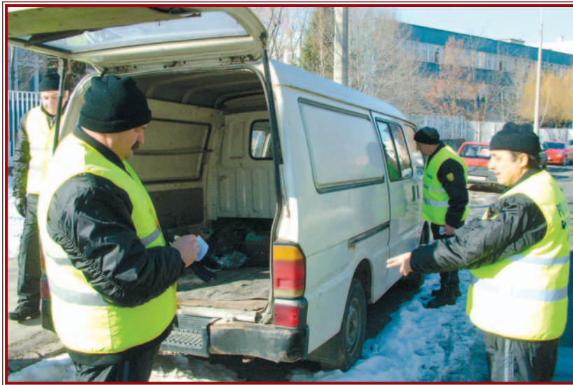
Az avasi polgárőrök az elhagyott, lerobbant autókat is ellenőrzik.