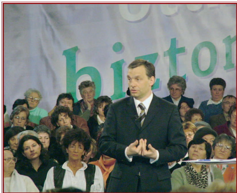
Orbán Viktor a diósgyőri birkózócsarnokban tartott fórumot.

Magyarország pénzügyi helyzetét firtató kérdésre elmondta: az elmúlt három évben 3500 milliárd forint hitelt vett fel hazánk, ami 350 ezer forintot jelent lakosonként a csecsemőtől az aggastyánig. Ehhez jön még a kormány szerint az elmúlt évben az EU-