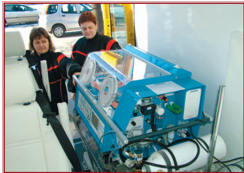
A speciálisan felszerelt mentőautó.

A HÉTEN MUTATTÁK BE AZT AZ INKUBÁTORRAL FELSZERELT, KORASZÜLÖTT-MENTÉSRE ALKALMAS GÉPKOCSIT, MELY A KÖZELMÚLTBAN KERÜLT A MEGYEI KÓRHÁZ KORASZÜLÖTT-ÚJSZÜLÖTTPATOLÓGIAI OSZTÁLYA HASZNÁLATÁBA.