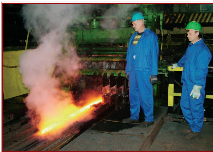
November közepén hosszas egyeztetések után újraindult a DAM.

A mintegy 7–800 fős dolgozói állományt a törvény szerintinél magasabb