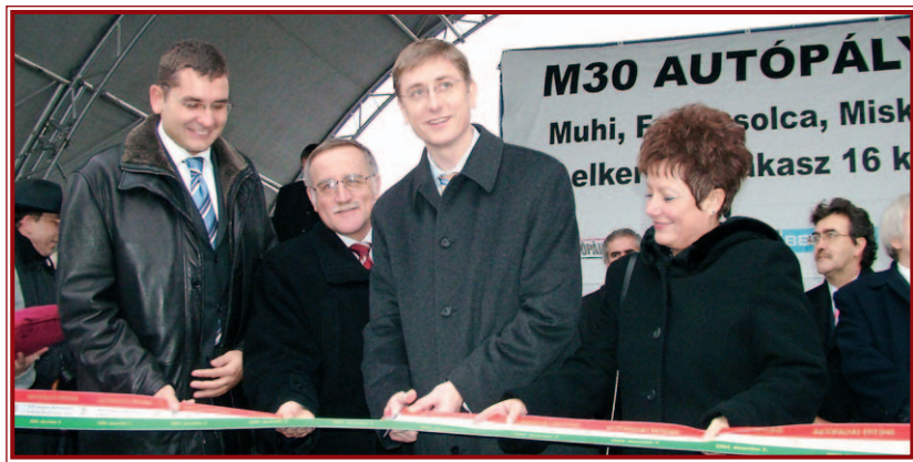
Decemberben átadták az autópályát: (balról jobbra) Kóka János gazdasági és közlekedési miniszter, Káli Sándor polgármester, Gyurcsány Ferenc miniszterelnök és Gyárfás Ildikó, a megyei közgyűlés elnöke.

Apropó, Bosch. A német mamutcég miskolci letelepedésének köszönhetjük a félgyűrű másik részét. A Bosch, a kormány és Miskolc között kötött szerző-