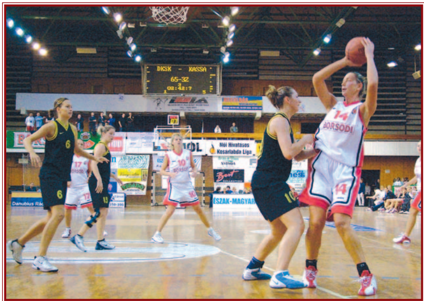
A kosaras lányok számára idén nem sok babér termett. Üdítő kivétel: a Kassa ellen vezet a DKSK.