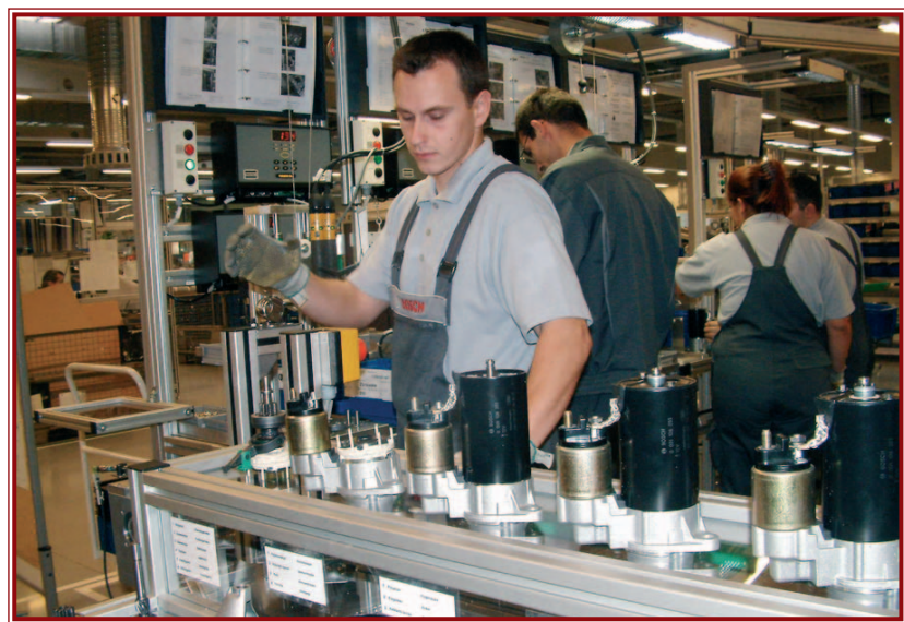
A Bosch elképzelései szerint a jelenlegi miskolci 350 fős dolgozói létszámot 2006-ra 800 fölé emelik.