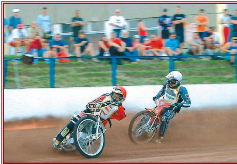
Idén hosszú évek óta először rendeztek versenyt a népkerti salakmotorpályán.

rüléshez szükség volt a létszámemelésre, a negyedik helyezés így NB I-et ért. Július 20-án az MLSZ elnökségi ülésén elutasították a DVTK 1910 Kft. beadványát, amelyben arra kérték a plénumot, hogy vizsgálja felül a Magyar Labdarúgó Liga klublicenc-kérelmével kapcsolatban hozott elutasító határozatát. Az Ott Erzsébet nevével fémjelzett gazdasági társaság nem kapott indulási jogot,