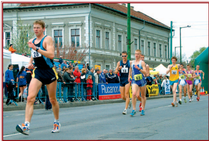
Az idei Nemzetközi Gyaloglógála a jövő évi gyalogló Európa-kupa főpróbája volt.