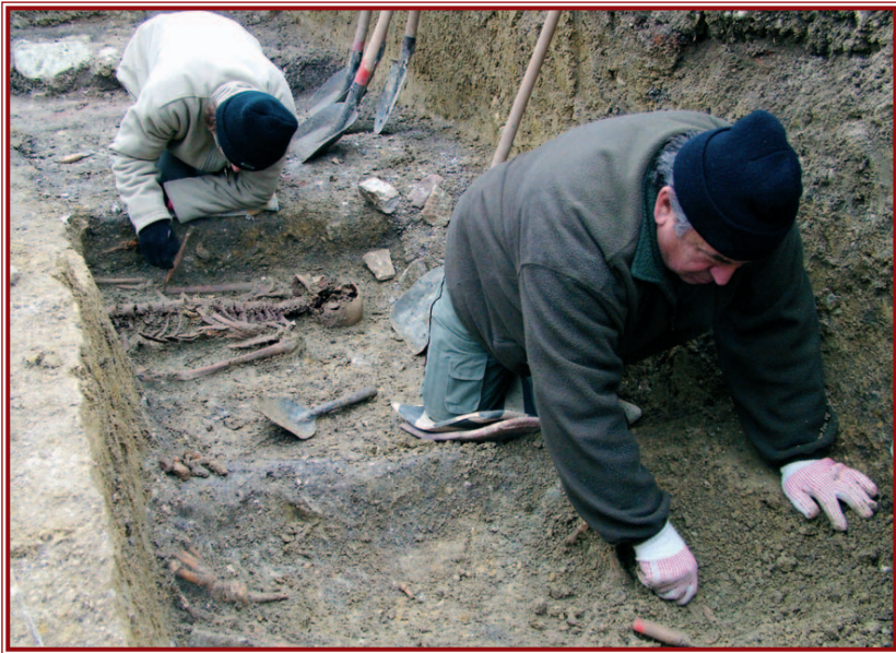
Az apátság romjai mellett temetkezési helyeket is találtak.

Nem meglepő, hogy valami „előkerült” a földből, hiszen már az ősember is ismerte a környéket. A meglepő inkább az, hogy csak most kerültek a felszínre az apátság romjai, mert az ásási szelvényeket több közművezeték is keresztezi, közvetlenül a romokat érintve. Ezért is fontos a nagyobb beruházások előtt, ahol leletek felszínre kerülésére lehet számítani, kötelező az építkezés megkezdése előtti régészeti kutatás. Ez történt most is, a barlangfürdő fejlesztésének folytatása előtt. A fennmaradt írásos forrásokból tudták, hogy Tapolcán az Árpád-házi királyok idején a városnak nevet adó Miskóc nemzetség bencés apátságát alapított. Az első említése 1210-ből származik, s 1533–34-ben pusztult el, amikor is a török távol tartására éppen horvát huszárok állomásoztak a környéken. Értékek után kutatva kirabolták, leégett. A szakemberek egy része az egyik közeli hegyen sejtette a romokat, más a fürdő közelében, már csak azért is, mivel az 1731-es leírás a fürdő mögötti területen említi az egykori apátság tornyát. Bizonyosságot azonban csak a december elején kezdett ásás hozott. Alig kezdtek neki a munkának, máris sikerült elcsípni a rom egyik részét a felszín közelében, s innentől kezdve „gyerekjáték” volt a szakemberek számára a továbbásás írá-