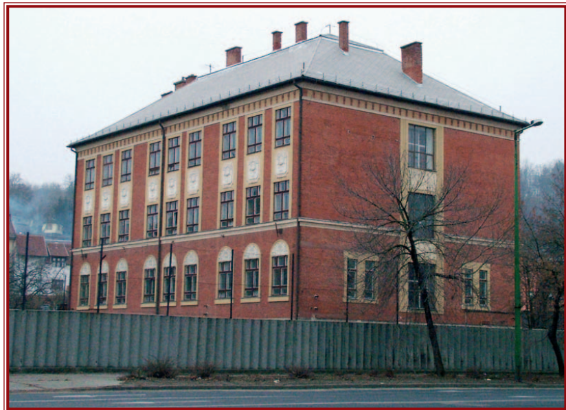
A Szentpáli iskola egykori épületének hasznosítása is vita tárgyát képezte.