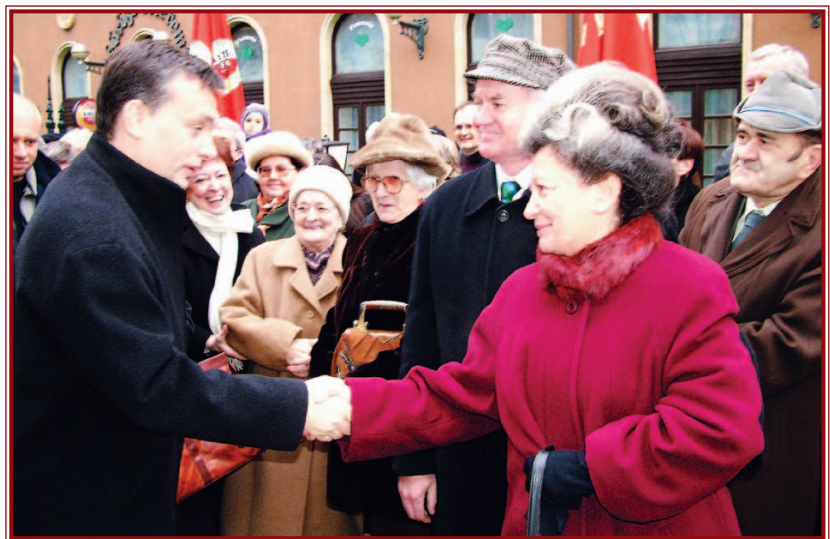
Orbán Viktor a nagygyűlés előtt a Kossuth utcán is találkozott a miskolciakkal.

A beszéd zárógondolatai akörül forogtak, hogy a magyar nemzetnek meg kell tanulnia a változásokat pozitívan értékelnie, hogy más nemzetekhez hasonlóan a javunkra tudjuk fordítani a lehetőségekben kínálkozó alkalmakat. „Mivel a Fidesz – Magyar Polgári Szövetség most nincs kormányon csak az őszinte és egyenes beszéd a megfelelő eszközünk, a céljaink megvalósításához, mindezek mellett, pedig hinni kell saját szorgalmunkban és tehetségünkben” – mondta végül Orbán Viktor. dob