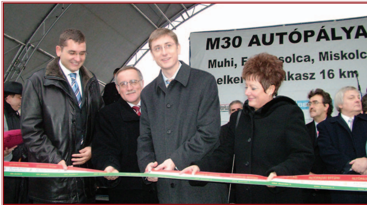
Átadták az autópályát: (balról jobbra) Kóka János gazdasági és közlekedési miniszter, Káli Sándor, Miskolc polgármestere, Gyurcsány Ferenc miniszterelnök és Gyárfás Ildikó a megyei közgyűlés elnöke.

Az M3-ast Miskolccal összekötő 24 kilométer hosszúságú M30-as egyébként két és fél év alatt készült el. A sztráda építése 2002 tavaszán kezdődött el Emődnél. Az első ötkilométeres szakaszt az év novemberében át is adták. Ez tette lehetővé, hogy az M3-ason Miskolc felé érkezők visszacsatlakozhassanak a 3-as útra. A következő, 8 kilométer hosszúságú – a muhi elágazásig tartó – pályaszakaszt egy évvel ezelőtt ve-