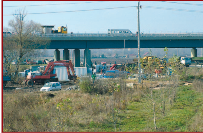
Az utolsó simításokat végzik a felsősolcai csomópontnál.

Az elkövetkező egy évben viszont az derült ki, hogy a vártnál nagyobb erőfeszítésekre lesz szükség, hiszen számos nem várt akadály hátráltatta az építkezést. Az építendő sztráda nyomvonalába eső telkek – különösen a Kistokaj és Miskolc között lévő rész – tulajdonosainak egy részével ugyanis nem sikerült simán megállapodni a területek eladásáról, pontosabban a földekért fizetendő árról. Mindez lassította a be-