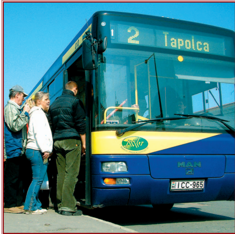
Folytatódik az MVK Rt. járműrekonstrukciója is.