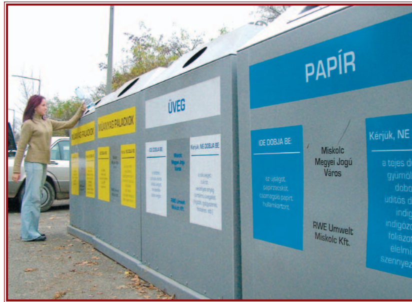
Miskolc a hulladékgyűjtő-szigeteket is pályázati pénzből építtette.

A kétmilliárd legnagyobb részét, összesen mintegy 900 millió forintot önkormányzatok kapják, összesen 33 és a humáninfrastruktúra fejlesztését végezhetik el belőle. Ezek révén 200-nál több új munkahely jöhet létre, és csaknem 200 maradhat meg hosszabb