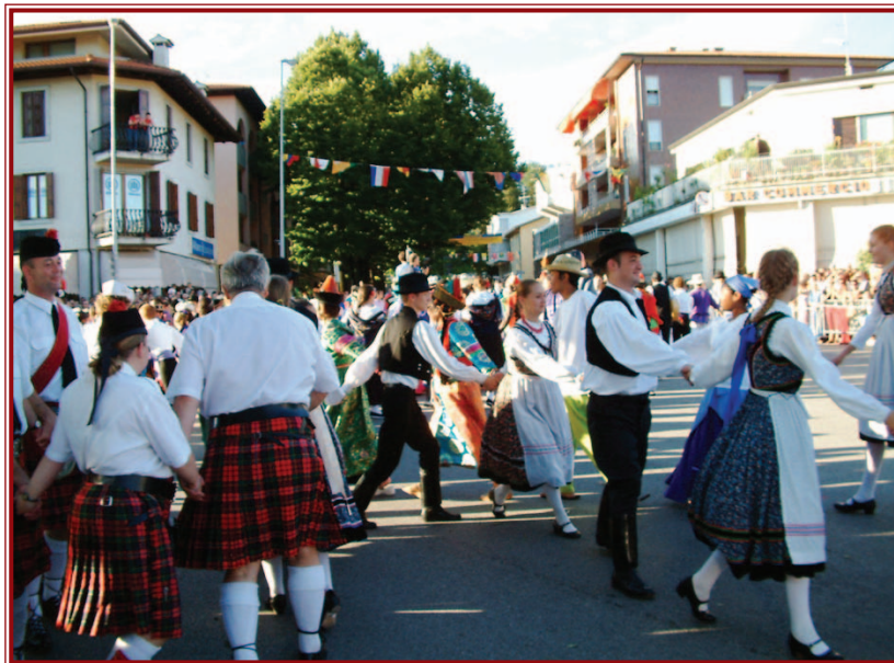
Fesztiváldíjjal jutalmazták a miskolci Avas Néptáncgyűttest Tarento városában.

Az Avas Néptáncgyűttes művészeti vezetője lapunknak arról is beszámolt: a fiatalodó, 16 év átlagéletkorral jellemezhető csoport a hagyományokhoz híven mozgalmos ószre számíthat. Ebben az időszakban érkeznek ugyanis az országszerte megrendezett szüreti felvonulásokra, bálókra szóló felkérések, melyeknek lehetőség szerint eleget is tesznek. Eközben újabb műsoruk összeállítását is tervezik: mivel repertoárjukon számos erdélyi tánc szerepel, a következő koreográfiával várhatóan környékbeli hagyományainkra fognak koncentrálni.