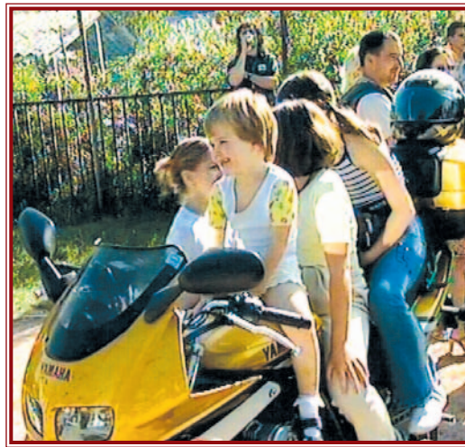
A gyerekek kipróbálhatták a motorokat is.