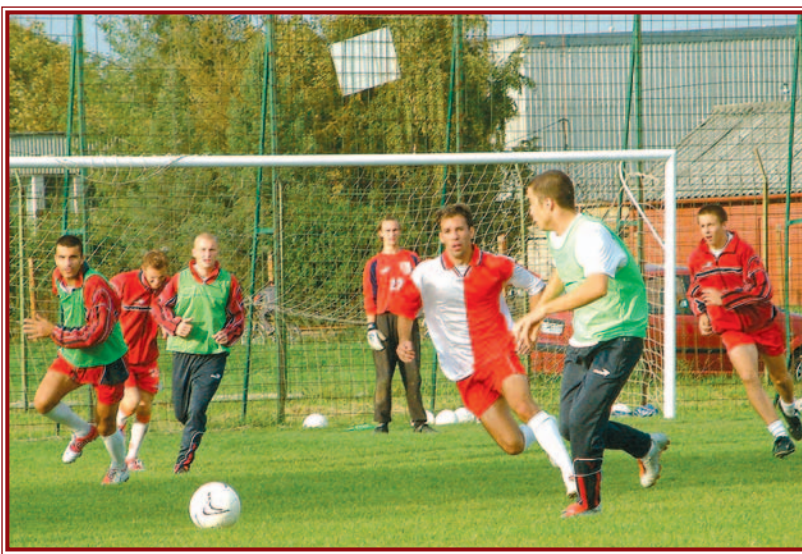
Nem hiába edzettek egész héten...