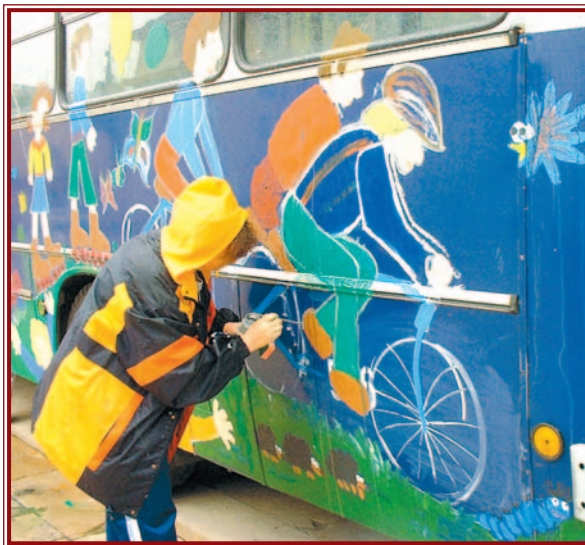
Az Autómentes Napon már hagyomány, hogy figyelemfelkeltő akcióként a buszokat is kifestik.

Miskolcon tavaly meglepő eredményeket hoztak az Autómentes Nap folyamán végzett vizsgálatok: a lezárt belvárosban 194 autóbussz hajtott át, azonban 4200 egyéb jármű szennyezése kímélte a belvárost. Az Észak-magyarországi Környezetvédelmi Felügyelőség mérőeszközei szerint 18 százalékkal csökkent a nitrogén-dioxid koncentráció, és a meglehetősen népes és hangos rendezvény ellenére is 4,8 decibelles zajcsökkenést mutattak ki.