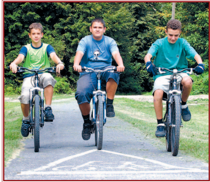
Ma még csak egyetlen kerékpárútja van Miskolcnak.

Az elképzelés egyébként az, hogy a várost keresztben és hosszában, tehát mindkét irányban átszelje egy-egy ke-