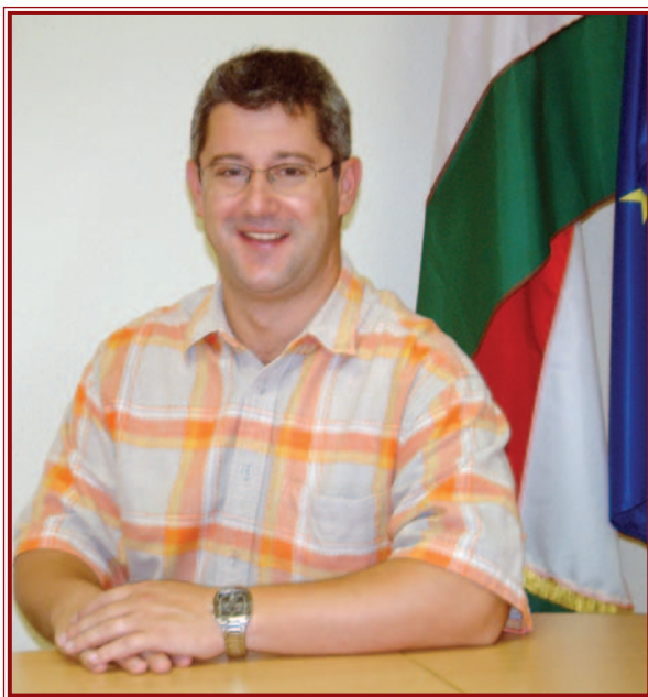
Nyakó István: „A kormányprogram végrehajtása nem személyfüggő.”

– A köztársaság parlamentjében a kisebbségi, emberjogi és vallásügyi bizott-