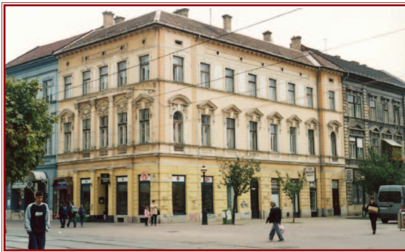
A Miskolcterv végezte a Széchenyi u. 2. sz. sarokház emeletráépítéses felújítását is.

1984 közepén-végén a Miskolctervnek már 100 dolgozója volt, profíljá