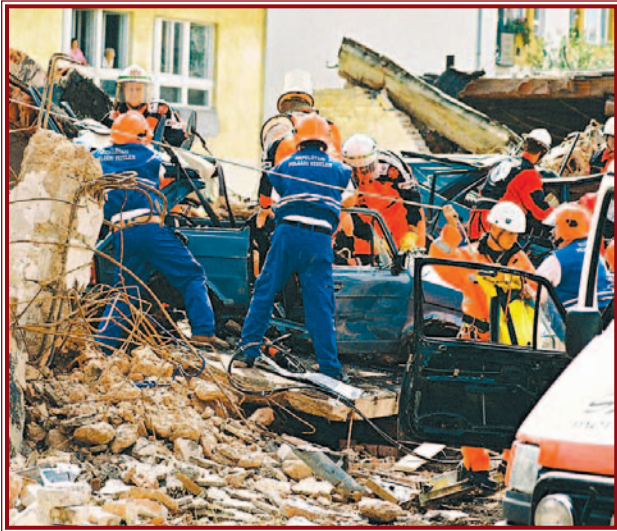
Szerencsére ez nem volt „éles” bevetés...

nél segédkezett. Összehasonlításként érdemes megemlíteni, hogy az elmúlt év 12 hónapjában ugyanez a szám elérte a 25-öt. A mentési feladatok szerkezetét jól jellemzi, hogy a klasszikusnak mondható munkák mellett a hernádi áradás ráadásaként funkcionált ebben az évben. Mindezek mellett sok időskori érdeklődés miatt elköbo-