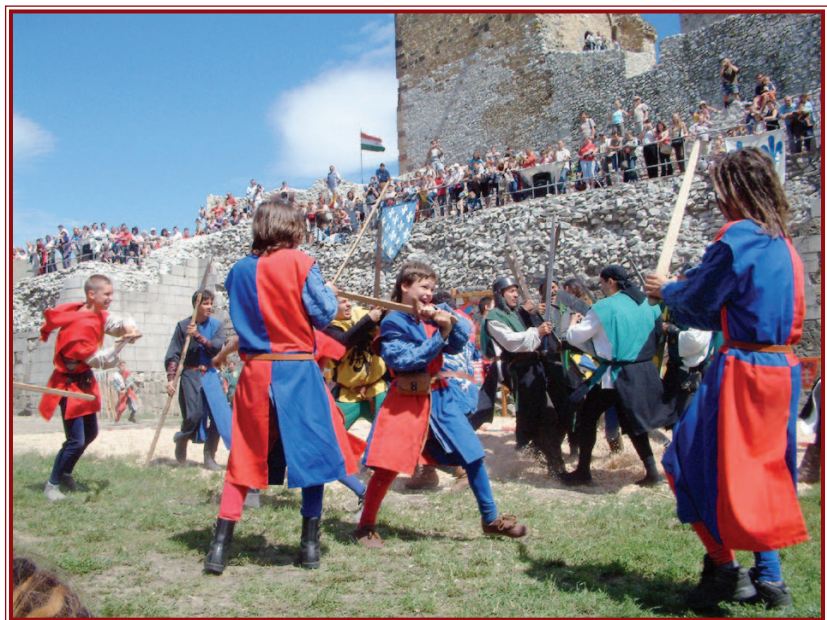
A Középkori Várnapokra ötezer jegyet adtak el a szervezők.