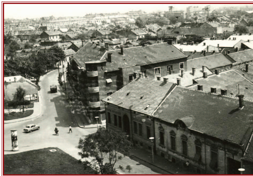
A Zöldfa u. – Vörösmarty u. – Dankó Pista u. „csomópont” a Bagolyvárral (1970).

nálási terve, majd a belváros első ütemé, amely a Dankó Pista u.–3. sz. főközlekedési út (Szilágyi Dezső u. meghosszabbítása)–Széchenyi–Szemere u. nagytömb területére terjedt ki. Ezen belül külön kellett kezelni a Szirma által átszelt Széchenyi u.–Arany János u. területet, ahol a mederszabályozási és lefedési munkálatok 1974 elején elkezdődtek. Az Avas II. ütemének folytatása a Pálkás, a Vöröshadsereg és a Kulich Gyula házait érintette. A Középszer és a Ruzsinfark területét a Csabai kapu, a Vöröshadsereg u. és a Tiszai pu.–LKM közötti iparvasút nyomvonala határolta. A Jókai utca környékének szanalása a Dózsa György–Fábián u.–Laborfalvi–Jókai és Fazekas utcák által határolt tömböt érintette. A sza-