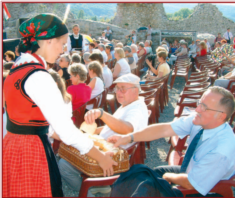
Káli Sándor polgármester megköstolja az új kenyeret.

– Egy más időpontban ünnepelünk, amikor a nemzeti lobogónk mellett az Európai Nemzetek Közösségének csilagos zászlaja is ott lobog – kezdte ünnepi beszédét délután Káli Sándor, Miskolc város polgármestere. Hozzátette: nincs még itt az ígért földje, de azt sem lehet mondani, hogy az elvégzett munkának ne lenne meg az eredménye. Ugyanakkor István szigora, népének olthatatlan szeretete mint ha hiányozna a mai közéletből – István király legnagyobb tette nem Koppany legyőzése vagy a vármegyék kiépítése, hanem a törvények megteremtése volt – jegyezte meg a polgármester.