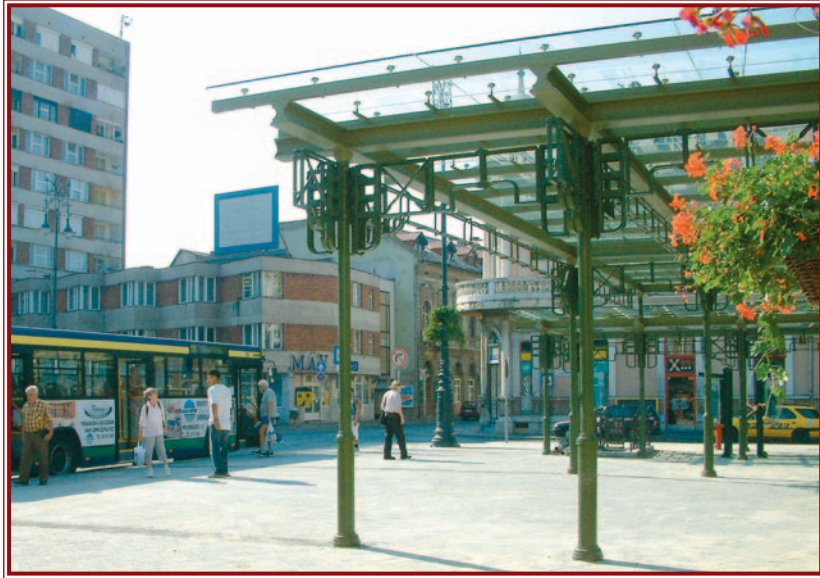
Az új, fedett buszmegálló a Villanyrendőrnél.