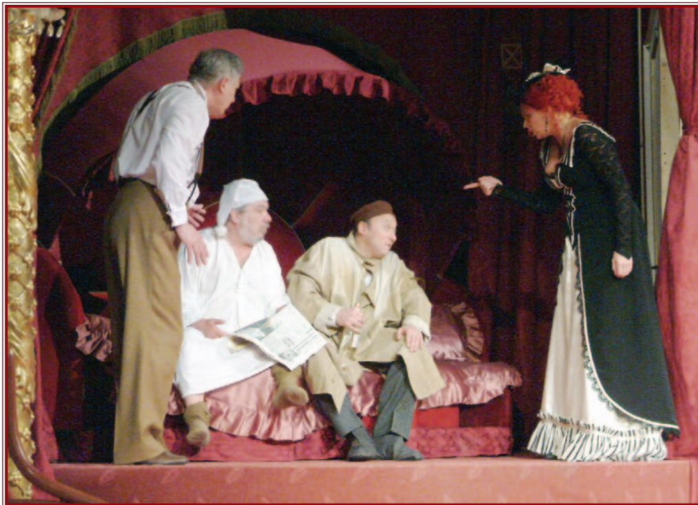
Az előző évad utolsó nagyszínházi bemutatója a Bolha a fülbe című bohózat volt – a nagy sikerre való tekintettel ez is műsoron marad.

S hogy a további bemutatók közül csupán néhányat említsünk: Régi nyár (zenés játék Balázs Péter rendezésében); Egerek és emberek (rendező: Tordy Géza); A Notre Dame-i toronyőr (roman-