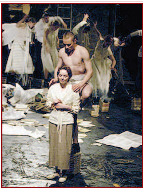
A beregszásziak idén ismét előadják a szarvassá változott fiú történetét.

A DIÓSGYŐRI VÁRSZÍNHÁZI ESTÉK HAGYOMÁNYOSAN AUGUSZTUSBAN VÁRJA SZÍNHÁZKEDVELŐ KÖZÖNSÉGÉT – AZ IDEI, TIZENHARMADIK RENDEZVÉNSOROZAT HÉTFŐTŐL, AZAZ 9-TŐL EGÉSZEN 18-IG KÍNÁL SOKSZÍNŰ, IGÉNYES SZÓRAKOZÁSI ÉS KIKAPCSOLÓDÁSI LEHETŐSÉGET NAGY LAJOS KIRÁLY EGYKORI, KEDVELT SZÉKHELYÉN.