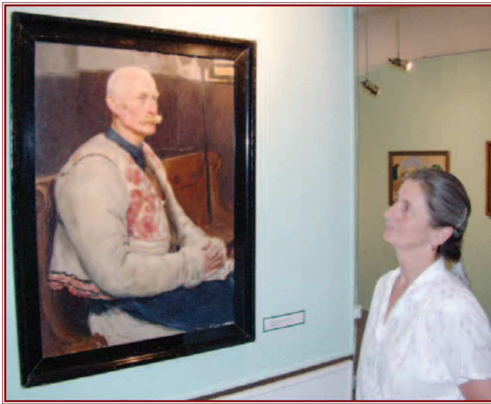
Augusztus végéig még megtekinthetik az érdeklődők a tárlatot.

száz magyar vonatkozású művészeti alkotást sikerült felkutatniuk, és a jövőben számos vándorkiállítást terveznek a hatalmas mennyiségű festmény bemutatására. Az alapítvány fő tevékenysége a kallódó magyar alkotások megkereséséből áll, ezt művészettörténészek és más szakemberek közreműködésével tudják megvalósítani. Az alapítvány többnyire a saját költségén tette kiállíthatóvá ezeket a képeket is, ezért minden segítséget elfogadnak, és önkéntesek jelentkezését is várják, hogy a többi alkotást is restaurálhassák. Hiszen csak akkor élvez-