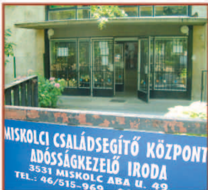
Három éve működik az iroda a Győri kapuban.

Az adósságkezelés három egységből áll az adós háztartásnak adós-