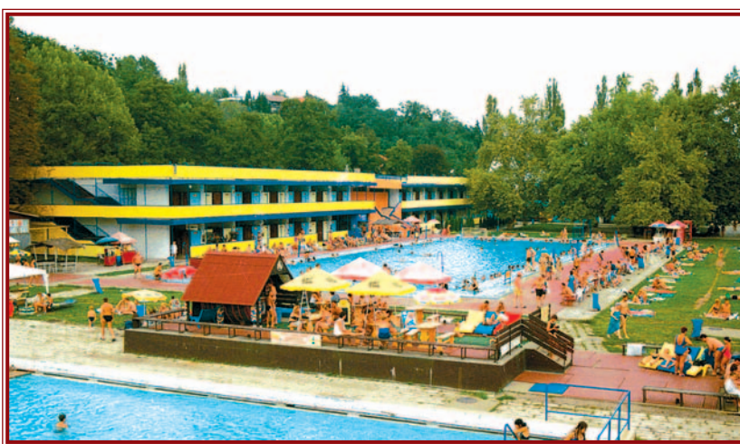
Európai hírűvé tennék a megújuló fürdőhelyet.

a fürdő infrastruktúra-fejlesztésén kívül minőségi szálláshely- és szolgáltatásfejlesztés fog megvalósulni. Idővel lehetőség lesz verseny- és tanuszoda építésére, és a völgy egyetemig terjedő szakaszának úgynevezett tájrehabilitációs fejlesztésére is. Tapolca ma valóban karakter nélküli részese az idegenforgalomnak. A Barlangfürdő hírneves, de nem kapcsolódik hozzá Tapolca a maga szolgáltatásaival. Az elmúlt években nem fejlődtek kellőképpen a rendezvények, nem alakult úgy