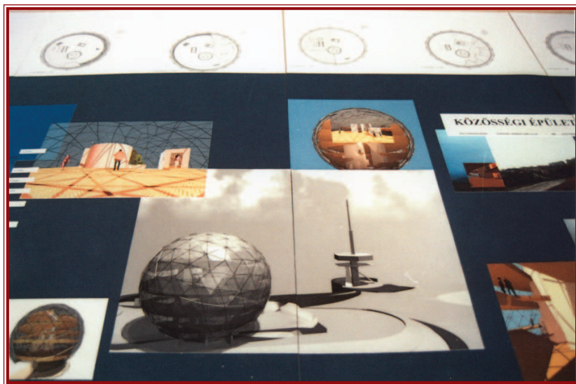
A közösségi ház látványtervei.