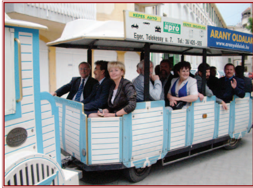
A képviselők a közgyűlés szünetében ki is próbálták a kisoronatot.