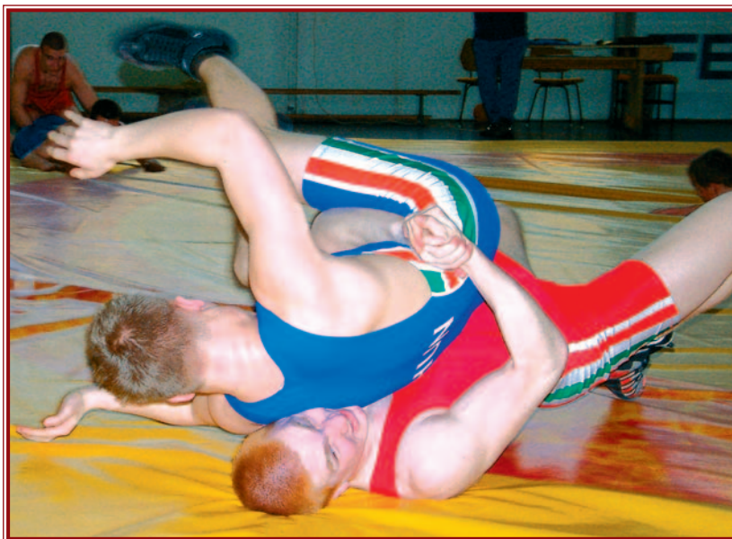
A DBC-MISI sportolótól ezúttal is jó szereplést várnak a szakvezetők.

– Kíváncsian várom a hermanos bemutatkozást, de nincs kétségem, hogy minden zökkenőmentesen zajlik, hiszen egy olyan csapat működik közre, amely az elmúlt évek során már összejelölt és kiállta a próbákat.