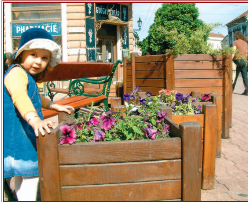
A cél, hogy az itt élőket és az ide látogatókat szép belváros fogadja.

A város más területein jelenleg is folyamatosan végzik a növények kiültetését. A munkálatok folyamatosságát azonban gátolta az évszakhoz mérten szokatlan időjárás. A külső időjárási tényezőktől függetlenül március elsejével megindult a zöldfelületek szellőztető gereblyézése. A külterjesen gondozott kategóriába sorolt területeken az allergén pázsitfűfélék virágzásához igazodva az első kaszálások már befejeződtek, mintegy 1,35 millió négyzetméteren.