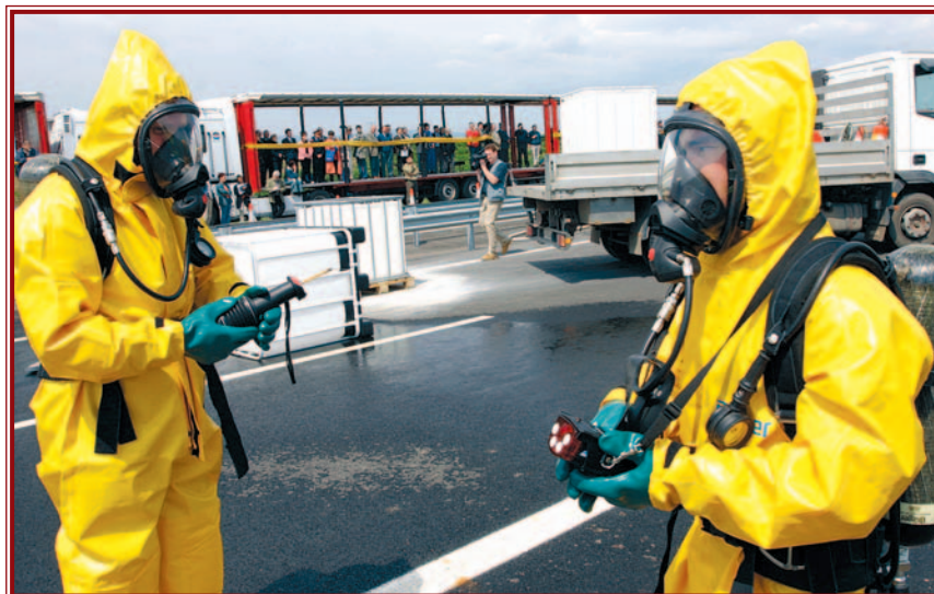
Jól vizsgázott a mentőalakulat.

Ezt erősíti meg értékelésükben az egyórási akciót kritikus szemekkel figyelő előjárók, és az ország különböző megyéiből érkezett katasztrófavédelmi kollégák.