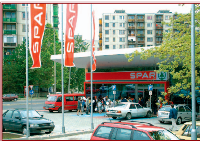
Forgalmas az új Spar.

CSÜTÖRTÖKÖN NYITOTTA MEG KAPUIT A MISKOLCI AVAS VÁROSRESZBEN A SPAR SZUPERMARKET. AZNAP ÉS TEGNAP ÓRIÁSI VOLT A FORGALOM AZ ÜZLETBEN.