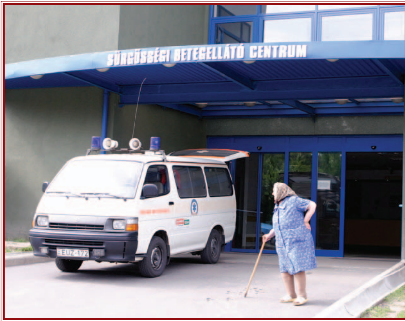
A helikopterleszálló megépítése a sürgősségi betegellátást segíti.

A felmérések szerint az emberek nagy többsége csak ritkán gondol bele abba, hogy vele is megtörténhet! Az esetlegesen bekövetkező balesetek azonban mindenkit ráébresztenek arra, hogy az egészségügyet nem lehet félvállról venni. Magyarán mondván: ezt az ágazatot minden körülmények között fejleszteni kell. Miskolc vezetősége a prioritásokat felismerve többlépcsős programot dolgozott ki, amely többek között előírja a Diósgyőri Kórház érdekeltiségeibe tartozó