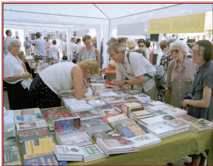
Akárcsak tavaly, idén is nagy kínálattal készülnek a kiadók az ünnepi könyvhétre.

A Magyar Könyvnap tervezetét a Magyar Könyvkiadók és Könyvkereskedők Országos Egyesületének 1927-ben tartott miskolci nagygyűlése előtt ismertette dr. Supka Géza. Az író, régész, műtörténész egy olyan – lehetőleg tavaszi – nap kijelölését szorgalmazta, melyen a könyvírás és -kiadás művészete „kimehet az utcára”. „Legyen ez a nap a könyv ünnepe, nemzeti műveltségünk manifesztaációja, legyen ez a nap a könyv, a tudás, a kultúra ünnepe, amely ünnepnap közvetlenül és évről évre meg-