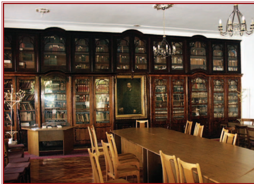
Az evangélikus könyvtár olvasóterme