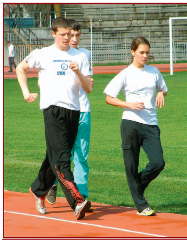
A DIAC gyaloglói emlékeztetéssel tehetik a nagydíjat.

Aligha férhet kétség ahhoz, hogy az indulók számát illetően a nemzetközi gyaloglóverseny keretében lebonyolítandó tömegsportrendezvény viheti el a pálmát. A szervezők ugyanis úgy gondolták, hogy kiírják a családok vetélkedését, melynek során nem ragaszkodnak a szó szerinti gyalogláshoz. Minden megengedett, a lényeg a részvétel. A rajthoz állóknak a kijelölt pályán 1 kört, két kilométert kell megtenniük. S hogy mindezt hogyan? Nos, lehet sétálni, gyalogolni, kocogni, akár még babakocsit tolvá is teljesíthető a táv. Nevezni 11 óra 45 percig lehet, a rajt 12 órakor lesz. Az első ötven célba érkező pólót kap, de kiosztják még