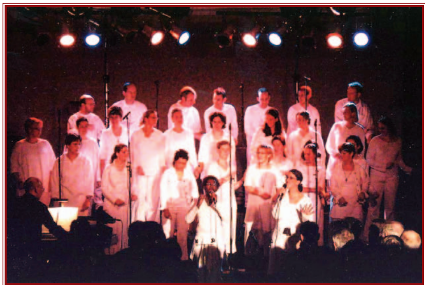
A Shirchadasj kórus Miskolcon is fellép.

HOLLANDIÁBÓL ÉRKEZNEK, S A MODERN ZENAI ESZKÖZÖKET IS FELHASZNÁLVA HIRDETIK A KERESZTÉNYSÉG ÖRÖMHÍRÉT. IGAZI SZÍNHÁZI PRODUKCIÓT ÍGÉRNEK A MÁJUS 3-ÁN DÉLUTÁN EMÓDÓN, ESTE A DIÓSGYŐRI VÁRBAN, MÁSNAP PEDIG SZIKSZÓN TARTANDÓ KONCERTJÜKRE. A SHIRCHADASJ KÓRUSRÓL VAN SZÓ, MELLY FENNÁLLÁSÁNAK HARMADIK ÉVTIZEDÉT ÜNNEPLI AZ IDÉN.