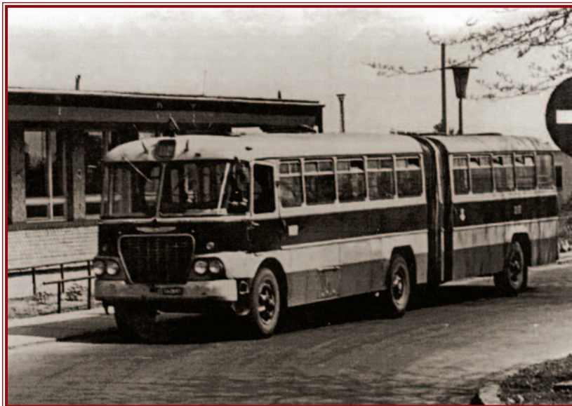
Az 1965-ben elkészült repülőtéri végállomás az Ikarus 620-as busszal.

A nagy lakótelepi építkezések megindulása az autóbusszforgalom fejlesztését is szükségessé tette. Ennek eredménye, hogy 1964–65-ben korszerű autóbussz-végállomások épültek a Béke (va-