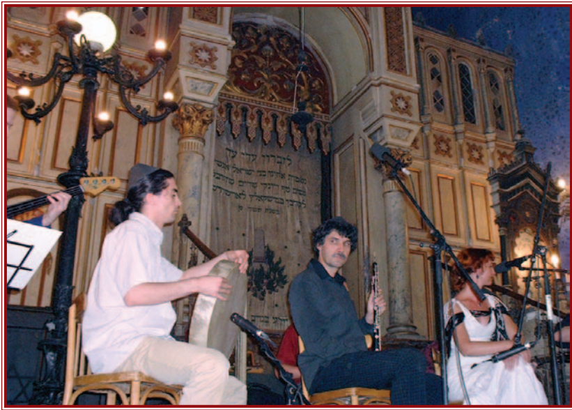
A miskolci zsinagóga a magyar romantikus építészet egyik kiemelkedő alkotása.