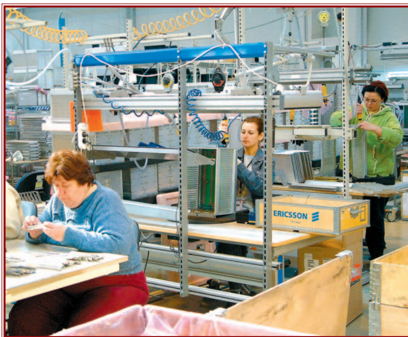
Az alsószolcai Sanmina Kft. is a nyertesek közé tartozik.

A legfrissebb munkaerőpiaci adatok áttekintésével kezdtük a beszélgetést Gúr Nándorral. A foglalkoztatáspolitikában jártas szakember kiemelte, márciusban – az országos tendenciához hasonlóan – megyénkben is csökkent a regisztrált munkanélküliek száma a korábbi év hasonló időszakához képest. A helyzet tehát bizonyos szempontból javult Borsod-Abaúj-Zemplénben, ugyanakkor ott van a DAM, pontosabban a Borsodi Nemesacél Acélgyártó Kft. sorsa, amely máig bizonytalan. Gúr Nándor fontosnak tartotta megjegyezni, hogy az elmúlt évben 1 milliárd forintot meghaladó összeget biztosított a munkaügyi tárca a társaságnál dolgozók bérének támogatására. A cég azonban nem tudott nyereségesen termelni, és a finanszí-