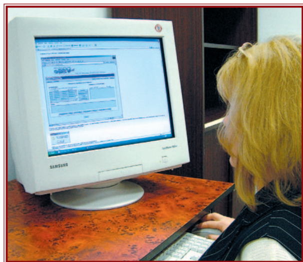
A nyomtatványok az APEH honlapjáról is letölthetők.

Az APEH ezzel kapcsolatos tájékoztatójából kiderül, hogy a tevékenységüket kezdő adózók a körzetközponti jegyzőnél a bejelentkezéssel egyidőben kérhetik az uniós adószámot, a közvetlenül az APEH-nál bejelentkezők pedig a 101 és 201 jelű