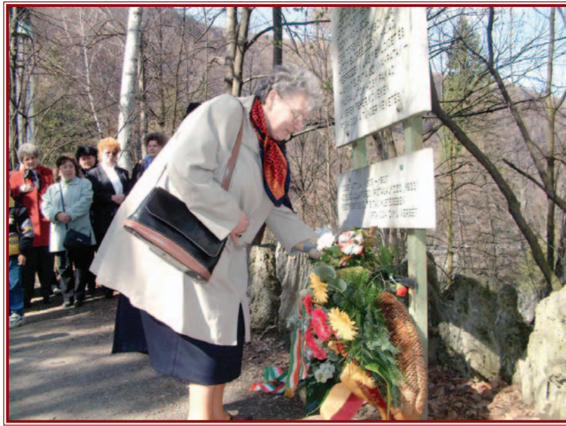
Az ünnep hagyományos akkordjaként pénteken délelőtt rendeztek koszorúzási ünnepséget József Attila lillafüredi emléktáblájánál.