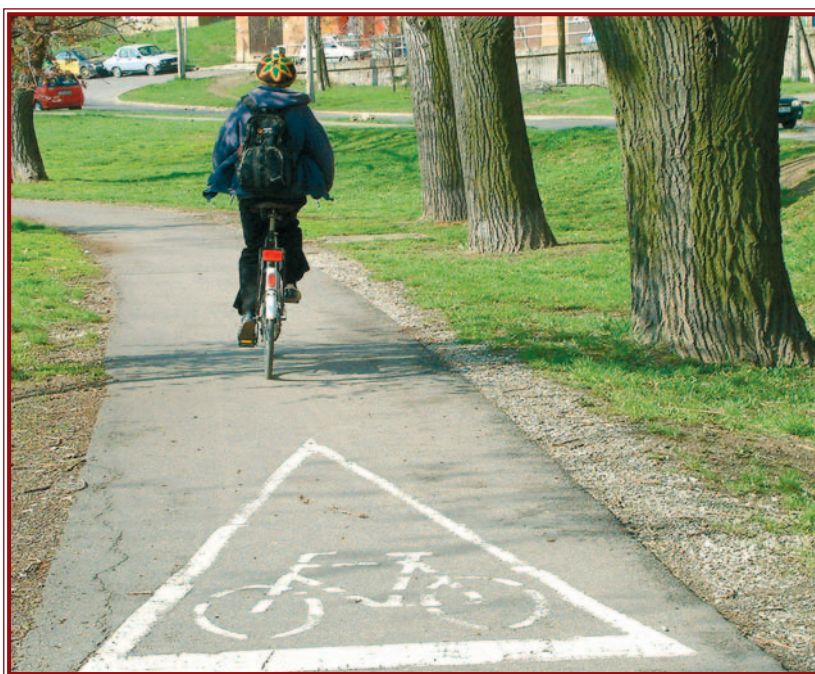
Miskolc eddigi egyetlen kerékpárútja Tapolca felé vezet.

A város vezetése – többek között – európai uniós pénzforsrással segítséggel szeretné a már meglévő tapolcai kerékpárutat összekötni a város központjával és kialakítani egy belvárosi biciklis közlekedési rendszert. A miskolci biciklis központ a Petőfi tér lehetne. Onnan indulnának ki – több irányba – a város forgalmasabb helyeit behálózó utak. Ehhez persze meg kell vizsgálni a már meglévő elképzeléseket és terveket is.