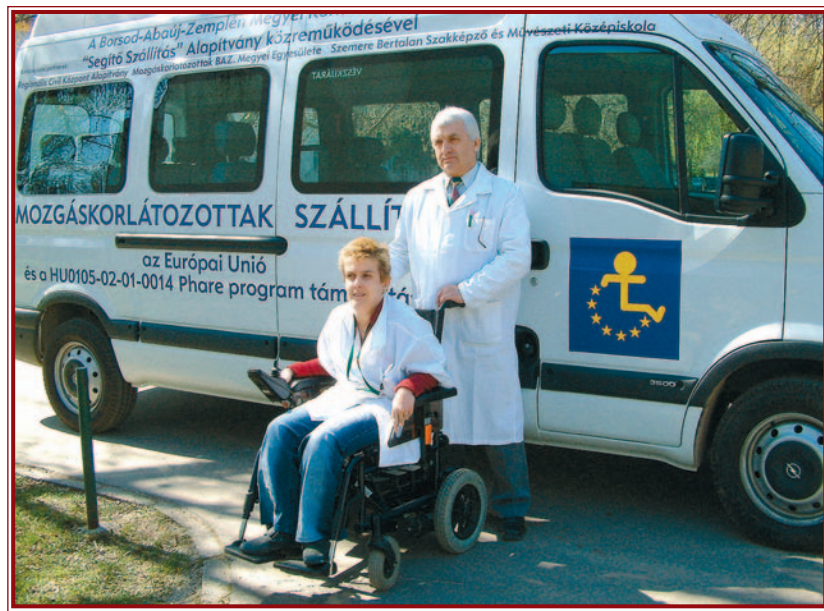
A programban részt vevők közlekedését egy speciális busz is segíti.

A Jogi Segítségnyújtó Szolgálat Borsod-Abaúj-Zemplén megyei irodája Miskolcon a Mindszent tér 3. szám alatt található. Az ügyfeleket hétfőnként 9 órától 13 óráig várják, szerdán pedig 13 órától 18 óráig állnak az érintettek rendelkezésére. Az iroda telefonszáma: 46/500-290.