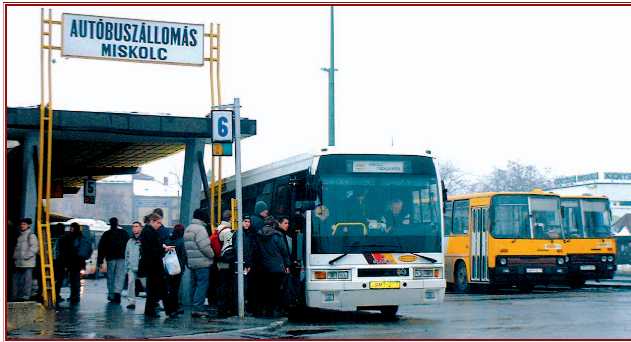
A Volán és az MVK Rt. összevonásán munkálkodik a miskolci önkormányzat.

A kormány emellett azt is eldöntötte, hogy a tartósan állami tulajdonban maradó vagyonkörből kikerültek a törvény által érintett cégek körébe tartozó Volán-társaságok. Pécs, Szeged és Debrecen városa már jelezte is az ÁPV Rt.-nél igényét a te-