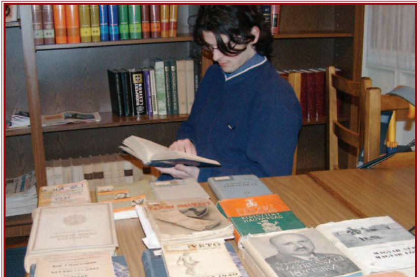
A kiállítás anyagát 75 év könyvnapi köteteiből válogatják össze.

UGYAN MESSZE MÉG AZ IDEI KÖNYVHÉT JÚNIUS 2-ÁN TARTANDÓ MEGNYITÓJA, AZ ÍRÓK ÉS A KIADÓK, MIKÉNT A MISKOLCI RENDEZVÉNYEK FŐSZERVEZŐJE, A VÁROSI KÖNYVTÁR JAVÁBAN KÉSZÜL MÁR E NEVES ESEMÉNYRE. KÜLÖNÖS TEKINTETTEL ARRA, HOGY AZ IDÉN JUBILÁL IS A KÖNYV ÜNNEPE.