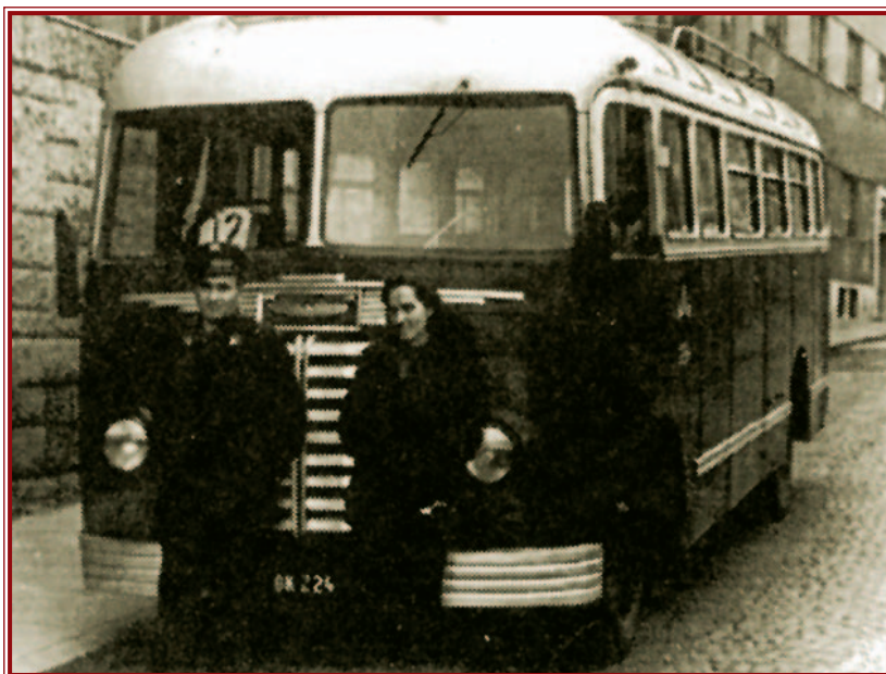
Az '50-es évek elején többnyire Ikarus 30-ok rótták Miskolc utcáit.

Az 1952-ben megindult 6-os járat a Városház tér és Perces között közlekedett. Ugyanebben az évben a Dózsa György úttól indult a 7-es vonal is, amely Felsőzsolcát kapcsolta be a forgalomba. A 2-es járat ez évben megszűnt, és ettől kezdve minden fővonalon 1-es számmal, de a Vasgyár érintésével közlekedett. A 2-es számot 1953. január 1-től a Forgóhíd–tapolcai vonal kapta. A közlekedés intenzív fejlesztésének eredményeként újabb járatok indultak Komlóstető,