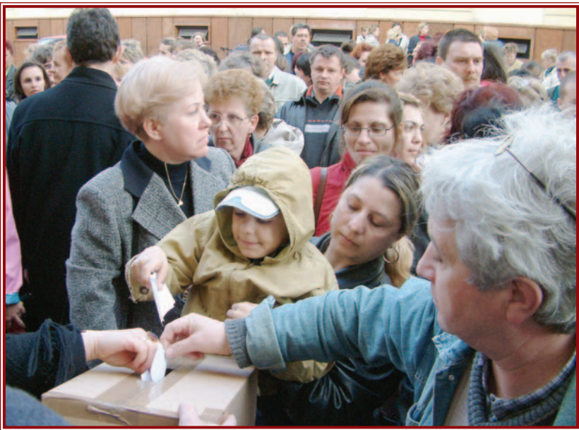
A demonstráción jelképesen szavaztak is a résztvevők.

DEMONSTRÁCIÓT SZERVEZETT A PEDAGÓGUSOK DEMOKRATIKUS SZAKSZERVEZETE (PDSZ) ÉS A MISKOLCI SZÜLŐI MUNKAKÖZÖSSÉGEK SZERDÁN DÉLUTÁN, A VÁROSHÁZA ELŐTT. AZ ÖSSZEGYÜLT HÁROMSZÁZ EMBER AZ OKTATÁSI INTÉZMÉNYEK INTEGRÁCIÓJA ELLEN TILTAKOZOTT.