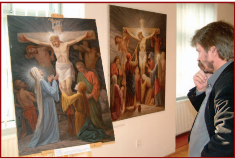
A tárlat a festő húsvéti ünnepkörhöz kapcsolódó alkotásait gyűjti egybe.