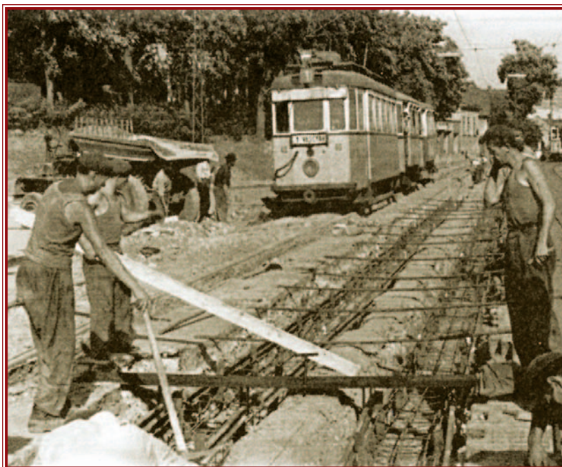
Vágányépítés a Szent Anna templom előtt.

A villamosvasút háború utáni kor- szerűsítése még ugyanebben az év- ben, azaz 1950-ben megkezdődött: a párt- és kormányhatározat alapján Mis- kolcot az ország második, nagyipari városává akarták fejleszteni. A terve- zés időszakában felvetődött, hogy eset- leg trolibuszt is indítsanak Miskolcon, ám ezt a koncepciót a szakemberek hamar elvetették, helyette a villamos fővonal teljes felújításáról, valamint a fővonal második vágányának megépíté- séről döntöttek. A Szent Anna temp- lom–Vasgyár közötti szakaszt 1951 kö- zepén adták át a forgalomnak, a Bar- oss Gábor utcától az Ady-hídig ve- zető új vágányt pedig 1952 áprilisá- ban helyezték üzembe. Az Ady-hídtől a belvárosra át a Szent Anna temp-