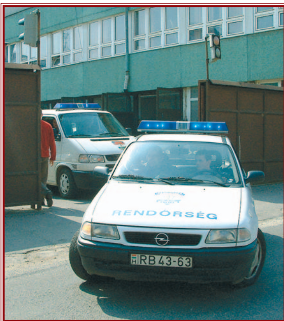
A vakriasztás a rendőröket a tényleges munkától vonja el. (Felvételünk illusztráció.)

A rendőrségi ügyeletes rutinján kívül azonban, hogy ki tudja-e szűrni a valótlannal bejelentéseket vagy sem. Léteznek bizonyos biztonsági technikák, így az előzetes szűrő a legtöbbször jól működik. Segítségét jelent például,