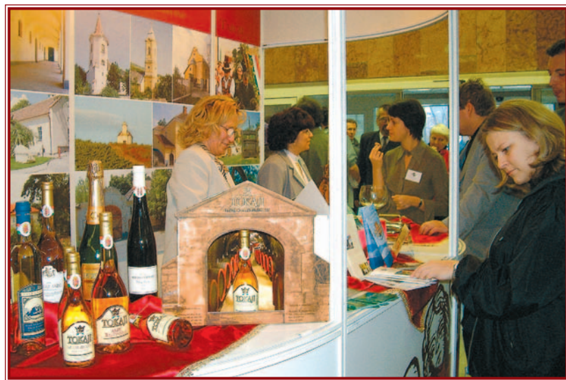
Idén Tarcal is bemutatkozhatott a kiállításon.