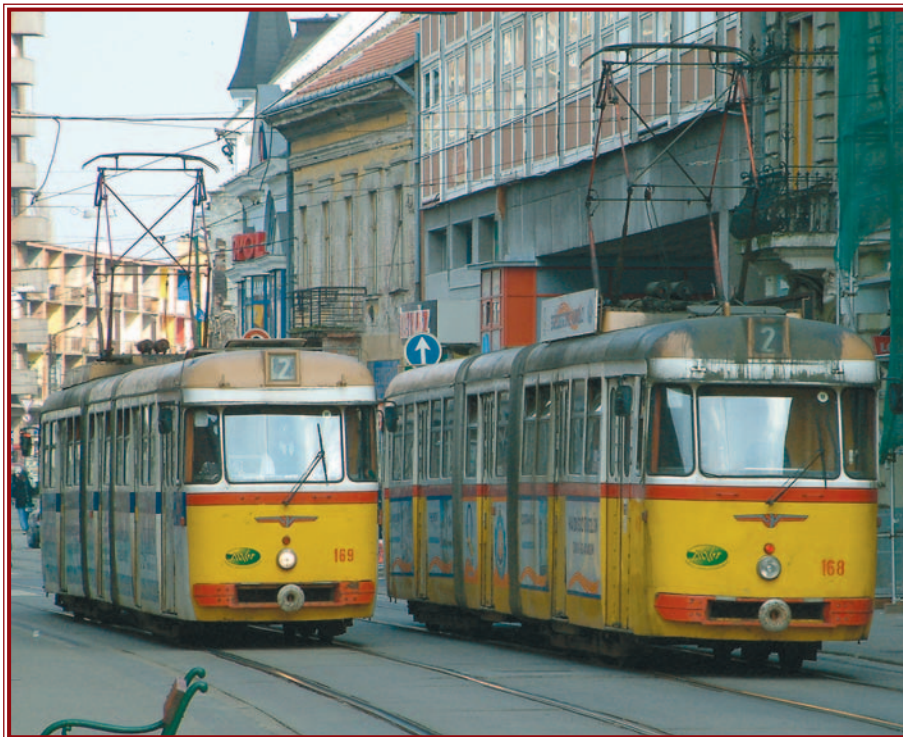
Miskolc hamarosan búcsút inthet a jó öreg „sárgáknak”.

A járműfejlesztések egyik részét a buszok, míg a másik összetevőjét a