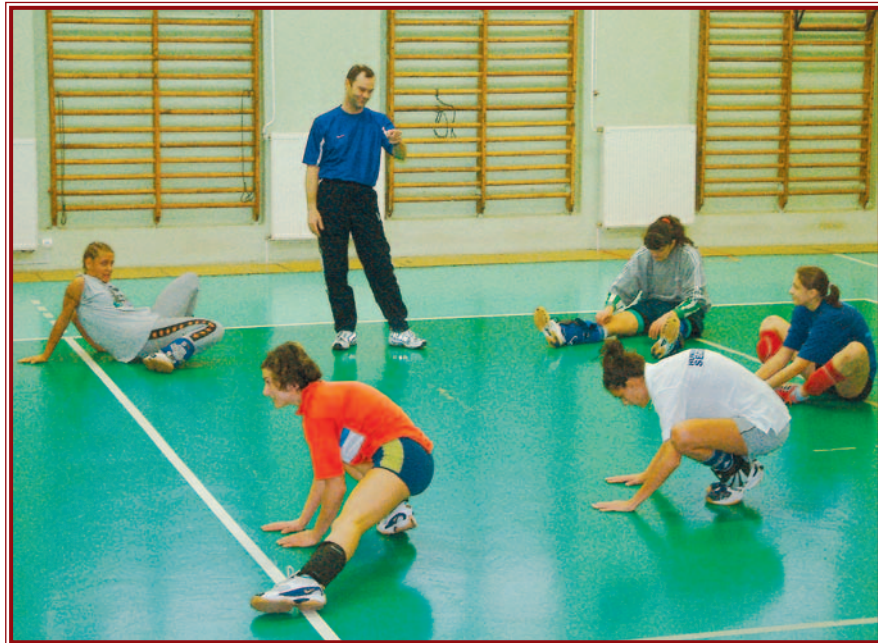
A Miskolcon sorra kerülő kupadöntőben ott lesz az MVSC-MISI együttese is, így a hazai szurkolóknak lesz kiért szorítani!

rül a nagy bravúr. Mindenesetre a helytállás megalapozhatja a vasárnapi, második találkozónk hangulatát.