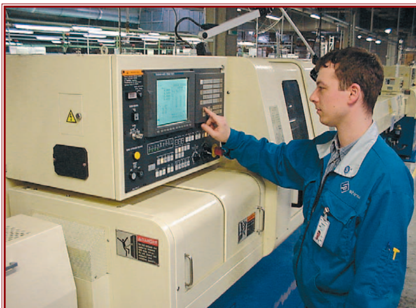
A Shinwában elégedettek a dolgozók munkájával.

Térségünk számára is fontos volt a zöldmezős, munkahelyeket is teremtő mintegy 25 millió dolláros beruházás, amelyhez végül is a megyei területfejlesztési tanács előbb 200 millió, majd újabb 170 millió forint vissza nem tér-