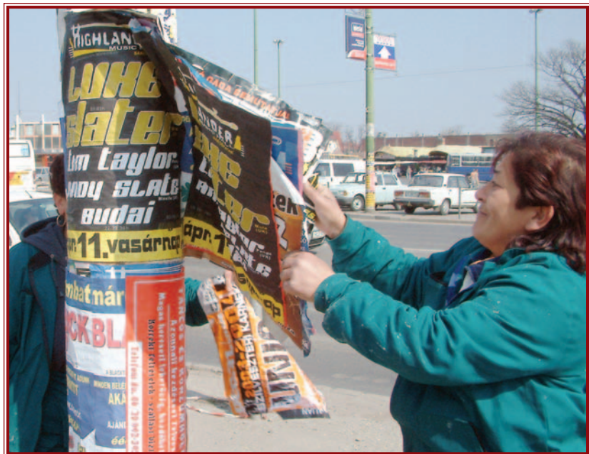
A plakátokat a Városgazda Kht. dolgozói tüntetik el a belvárosból.