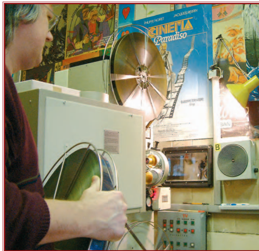
A fesztivál filmjeit már az új vetítővel mutatják be.

„Az Uránia később megépült, de más helyen. Miskolc 1930-ra vonatkozó név- és címtárában olvassuk, hogy a városnak továbbra is két „mozgóképszínház” van, egyik az Apolló a Széchenyi u. 17. szám alatt a Weidlich-udvarban, a másik az Uránia Filmszínház, amely a Rákóczi u. 3. szám alatt 1925. december 23-án Árva Pál tervei alapján épült és nyílt meg.” – derül ki Dobrossy István: Miskolc írásban és képekben 8. című kötetéből. A filmszínház 2001 elejéig, azaz 75 esztendőn át Béke mozi néven várta közönségét. Az Apolló 1930-ban költözött át a Weidlich-udvarból a Korona szálloda nagytermébe, s működik napjainkban is Kossuth Filmszínházként.