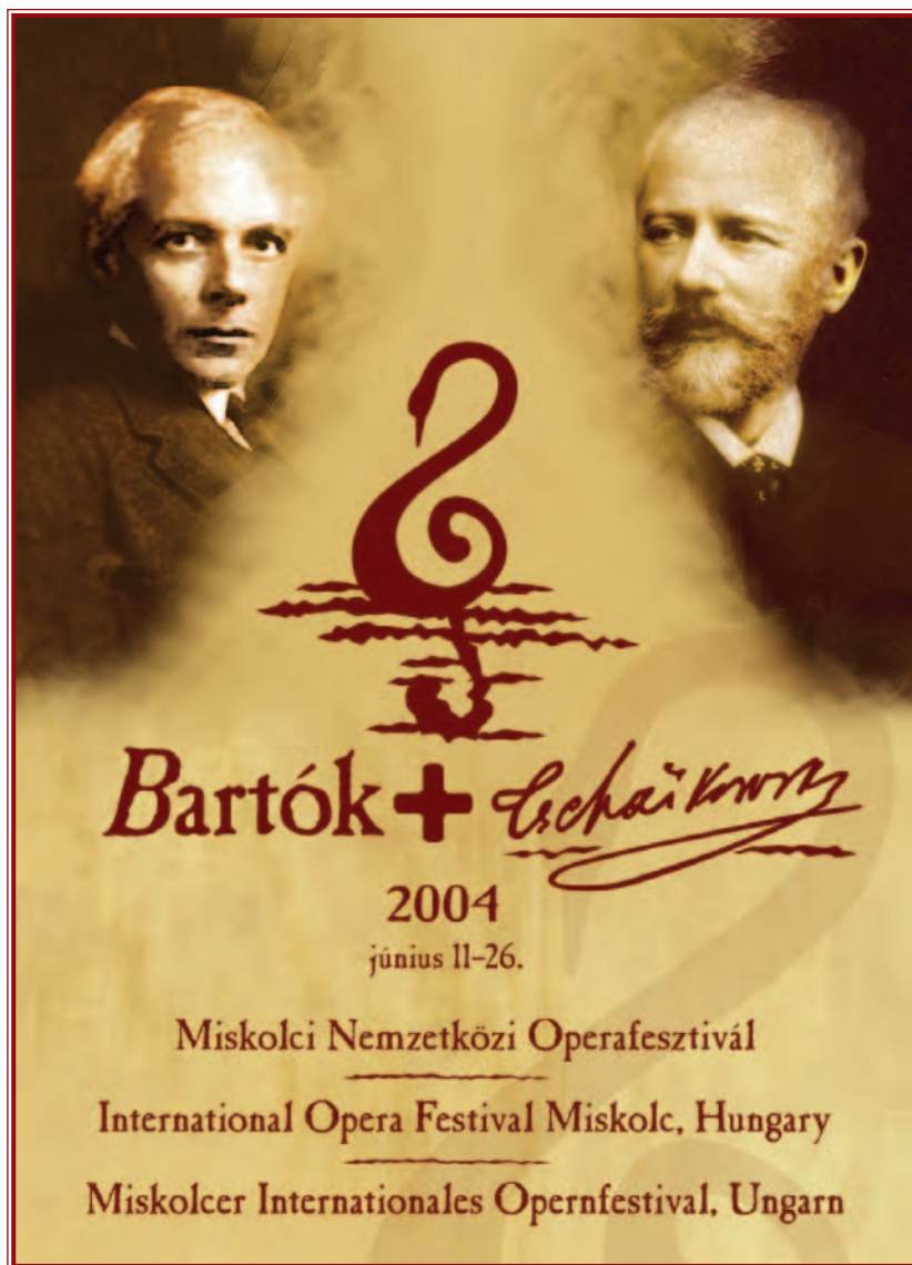
A Bartók + Csajkovszkij Miskolci Nemzetközi Operafesztivál: http://www.operafesztival.hu

A közelmúltban, a fesztivál előtti első, már hagyományos operaházi „beharangozón” pedig számos újdonságról szólt. Így többek között arról, hogy a Miskolci Nemzeti Színház saját produkcióval is jelentkezik a Bartók + Csajkovszkij rendezvényen: a kassai opera-