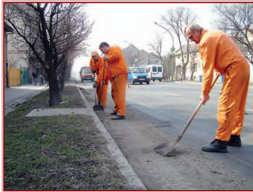
A Városgazda Kht. munkásai végzik a kézi takarítást.

A tavaszi városi nagytakarítás fontos eleme, hogy ingyenes lomtalanítást hirdetett az RWE Umwelt Miskolc Kft. A magánházak övezetekben március 22 és 26. között szállítják el az utcára kihelyezett, feleslegessé vált holmikat. A