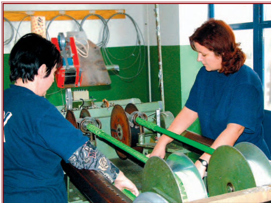
Nem várható tömeges áttelepülés Szlovákiába.

De térjünk vissza a miskolci Menjünk Világgá című kiállításra! Bárdos